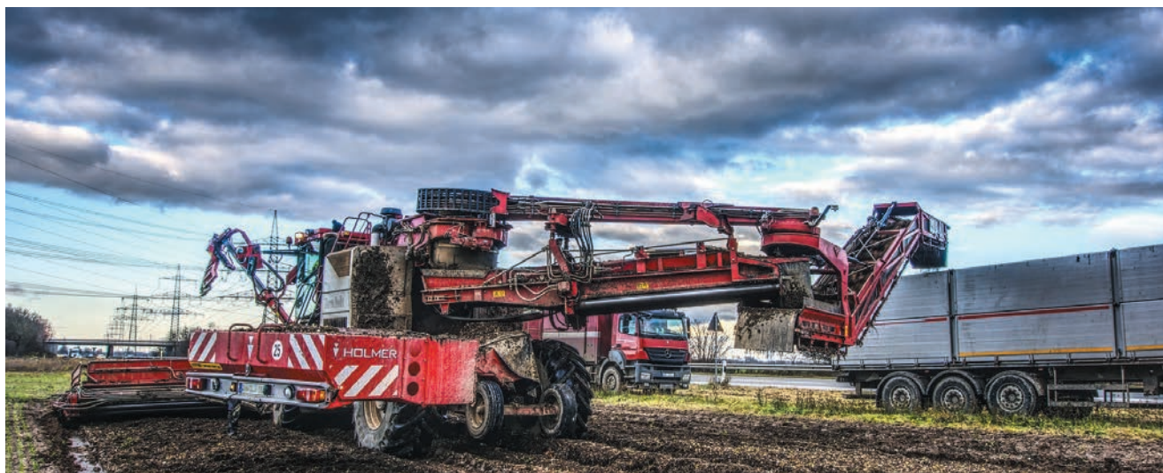
AZUCARERA DEBERÁ INDEMNIZAR A LOS AGRICULTORES QUE ENTREGARON REMOLACHA EN LA CAMPAÑA 2019-2020