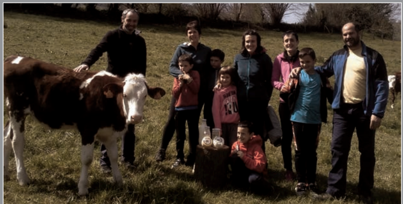
LA FAMILIA ÁZKARATE REGENTA UNA EXPLOTACIÓN LECHERA ECOLÓGICA

Los hermanos Azkarate regentan la única explotación de vacuno de leche ecológica que existe actualmente en Nafarroa, sita en la localidad baztandarra de Aniz, que inició su funcionamiento en 2004 y se reconvirtió a ecológica en 2009. Sus productos -además de leche, queso, yogures y batido de yogur- son demandados por centros educativos, hostelería y tiendas, además de la venta directa. Muchas de estas instituciones y negocios cerraron con los primeros meses del confinamiento. “De la noche a la mañana nos encontramos con que nuestra leche no tenía salida y tuvimos que reinventarnos. Como primera medida, regresamos a la venta que se hacía hace medio siglo, de casa en casa”, explican. Fue una vía para sacar adelante su