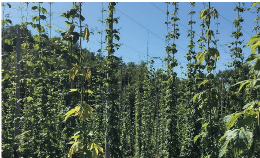
LA CAMPAÑA 2020 HA SIDO COMPLICADA.