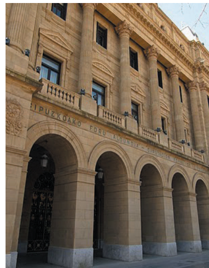
ESKAERA BAKARRA EGITEKO GARAIA DA

Gogoratu, aurten lehen aldiz, Eskaera Bakarrean aitortutako lurren monitorizazioa egingo dutela. Hau da, lur horiei bost egunetik behin satellite bidez argazkiak aterako dizkiete. Horregatik aurten, ArgazkiPAC aplikazioa erabiltzeko gakoa eta erabiltzaile izena emango dituzte Eskualdeko Nekazaritza Bulegoetan.