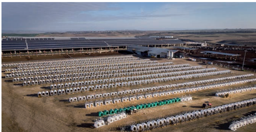
CAPARROSOKO MAKROGRANJA.