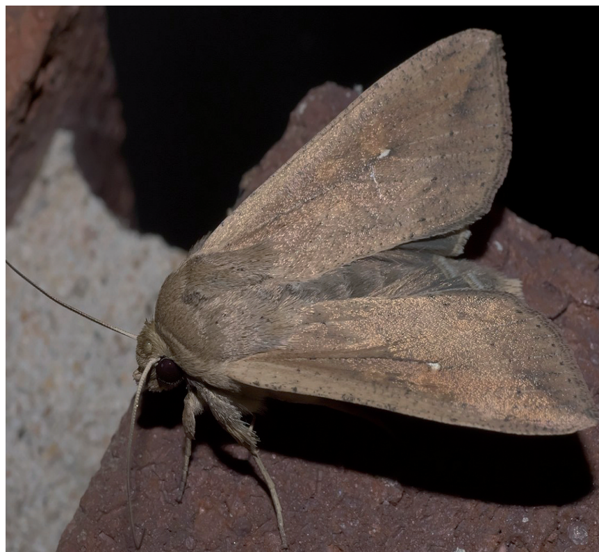
MYTHIMNA UNIPUNCTA ARRAREN TXIMELETA

Heldua: helduek 3-3,5 zm-ko luzera izaten dute eta hegoak nabar kaoba kolorekoak ditu. Hegoaren erdian puntu txuri nabarmena dute Errunaldian 700 arrautza zurixka jartzen ditu, 10-40 arrautzako ilaretan. Beldarra: 3-3,5 cm-ko luzera dute. Kolore aldakorra dute elikaduraren arabera. Halere, nabarmenena, hiru marra dortsal dira. Marrak zurixkak