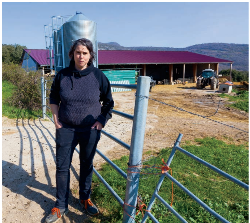
LA PRESIDENTA DEL CPAEN, JUNTO A SU GRANJA

Nos habría gustado disponer de algún otro espacio más céntrico en Pamplona, como podía haber sido la Ciudadela, pero ha resultado imposible. En todo caso, Noain también es una localidad de fácil acceso desde cualquier punto de Navarra y entendemos que esta histórica fecha va a ser todo un éxito de participación y contenidos.