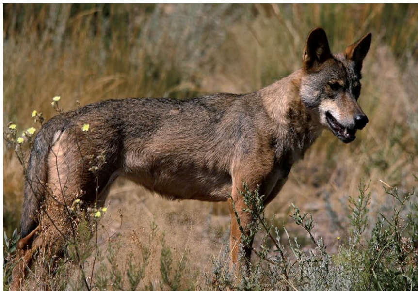
IBERIAR PENINTSULAKO OTSOAREN IRUDIA

Bestetik, Trantsizio Ekologikoa eta Erronka Demografikorako Ministeritzari mendiko abeltzaintzaren aldeko apustua egin dezan eska diezaioten proposatu zaie.