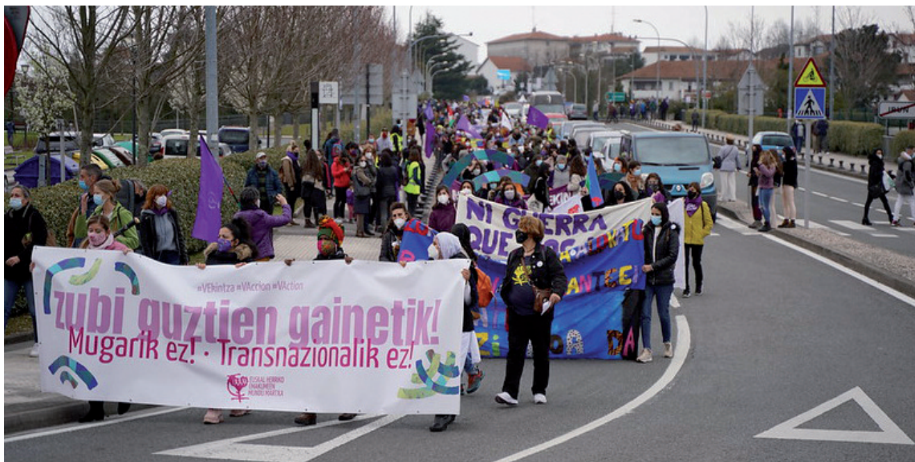
IRUNEN EGINDAKO MOBILIZAZIOKO IRUDIA