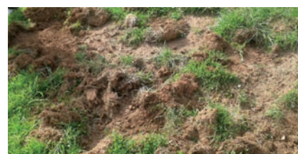
BASURDEEN KALTEAK ZELAI BATEAN

Gipuzkoako Foru Aldundiak, segurtasun eremu gisa izendatutako lekuetan basurdeak ehizatze baimena eman duela adierazi du: "Salbuespen gisa segurtasun eremuetan ehiza ekintza zehatzak egitea baimen daiteke, pertsonak arriskuan jartzea edo nekazaritzaren, abeltzaintzaren, basoen edo basa faunaren aurkako kalteak saiheste aldera". Aldundiak aitortzen du azken urteotan basurdeen populazioa nabarmen igo dela eta kalteak areagotzen ari direla, horregatik baimendu du segurtasun eremuetan ehizatzea, bestela basurdeak bertan babesten direlako eta haien kontrola egitea zailtzen dutelako. Zerainean hiru eremu; Astigarragan Santio mendin eremu bat; Idiazabalen hiru eremutan; Bidasoako bokalean eta Txingudi inguruan eremu bat eta Uliá mendian beste eremu bat baimendu dituzte bertan ehiza egin ahal izateko.