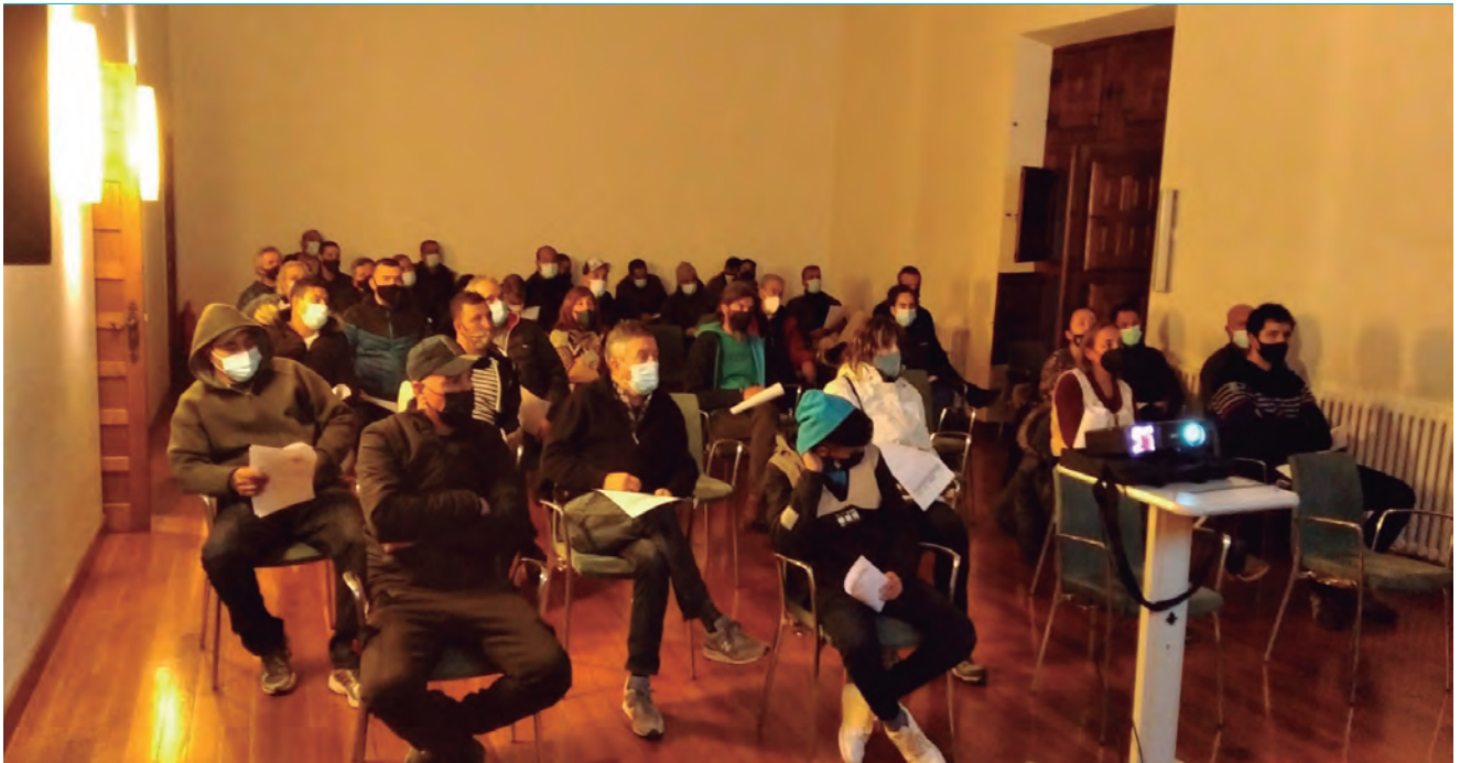
PARTICIPANTES EN LA CHARLA QUE SE REALIZÓ EN LIZARRA