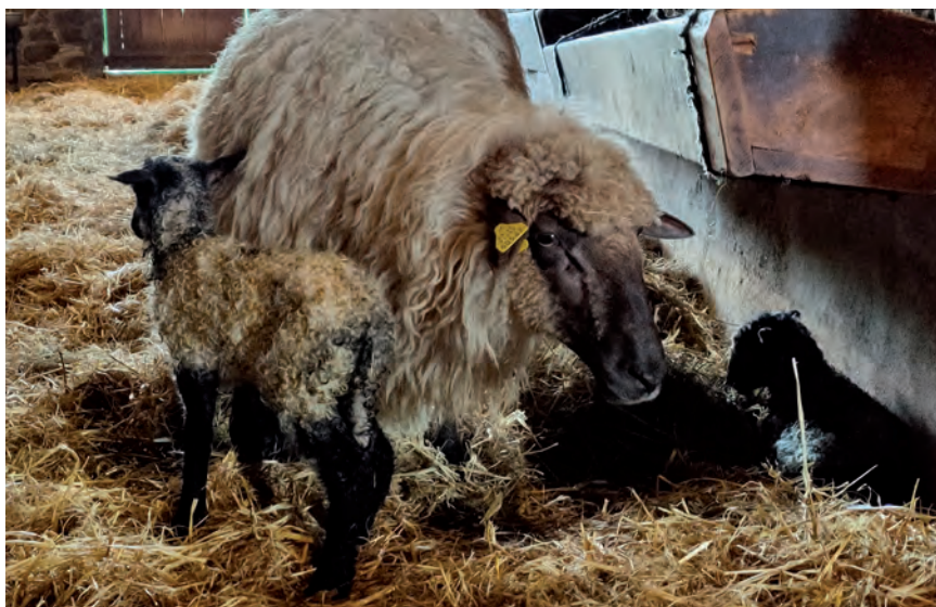
EL MERCADO DEMANDA CARNE DE CORDERO