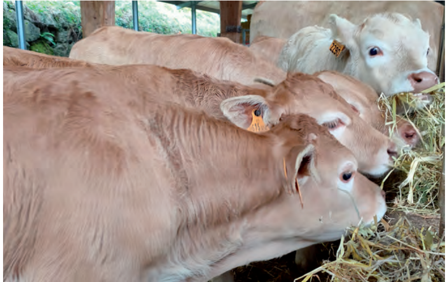
LA SUBIDA DEL CEREAL HA ARRASTRADO AL ALZA EL PRECIO DE LOS FORRAJES

Merkatuko egoera nahasia bizi dugu eta orokorrean goranzko joera garbiak dituen, eta lanean jarraituko dugu bilerekin edo mobilizazioekin baserriarrek jasoko duten prezioa behar den bezalakoa izan dadin. Ezin baitugu hain ezinbestekoa izan den oxigeno publikoaren zain egon.