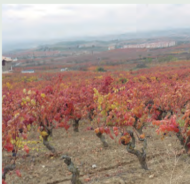
NO HABRÁ NUEVAS PLANTACIONES.