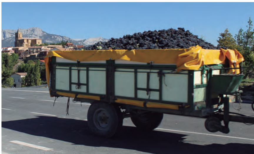
HA SIDO UNA CAMPAÑA ALGO MÁS LARGA Y ABUNDANTE.

Tanto es así, que aseguran que las primeras catas de las elaboraciones de la cosecha son muy prometedoras, con vinos muy aromáticos y con taninos muy redondos. El informe indica que, tras más de dos meses sin lluvia, de mediados de junio a septiembre, se esperaba la vendimia 2021 con un