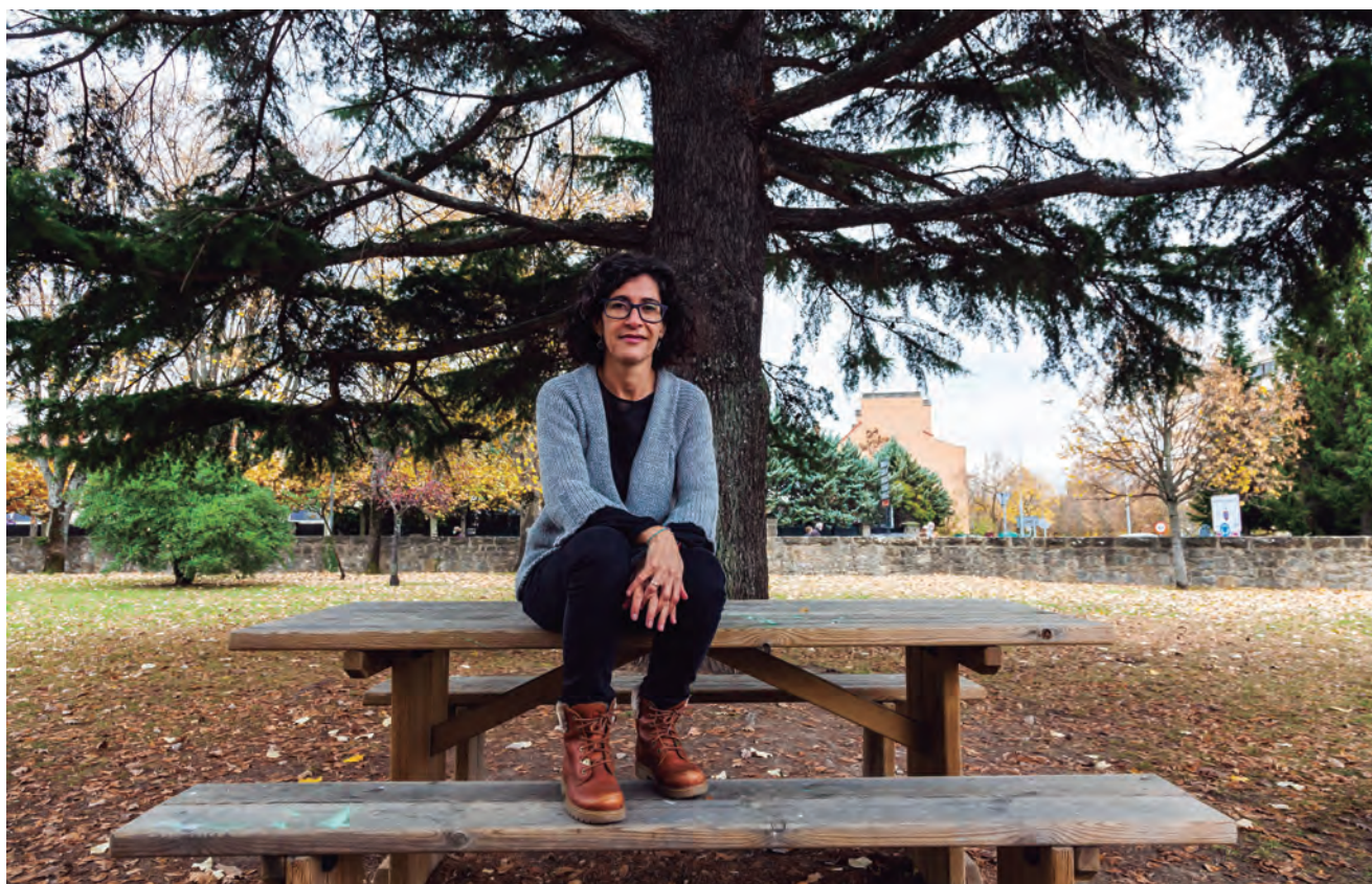
BELLOSTAS DESTACA QUE HAY EN NAVARRA UN NICHOS DE MERCADO DE PRODUCTOS ECOLÓGICOS QUE NO ESTÁ SIENDO CUBIERTO