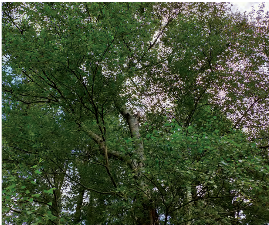
BASO POLITIKA ADOSTUA BEHAR DA