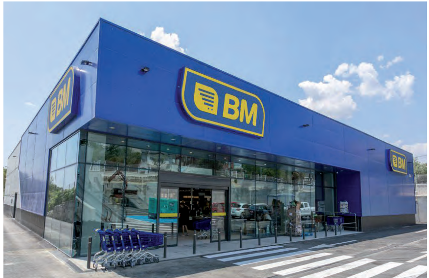
UVESCOREN BAITAKO BM SUPERMERKATUETAKO BATEN IRUDIA

El Grupo Uvesco indicó a los representantes de EHNE que con esta iniciativa pretende afianzar su apuesta por la carne de vacuno local que comercializa mediante su marca 'Bertako', ya que son conscientes de que "el sector productor está sufriendo un incremento en los costes de producción por lo que hay que subir