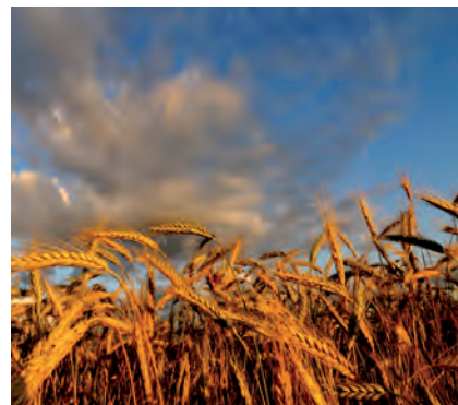
GARIA. IRUDIA LIBRE MERCADO

Merkatuan tentsioa sumatzen da, esportatzaile nagusien eskaintza eskasaren ondorioz. Hori dela eta, gariarentzako prezioen azpi-indizeak %5 egin zuen gora, eta azken hamarkadan izan duen preziorik altuena lortu du orain.