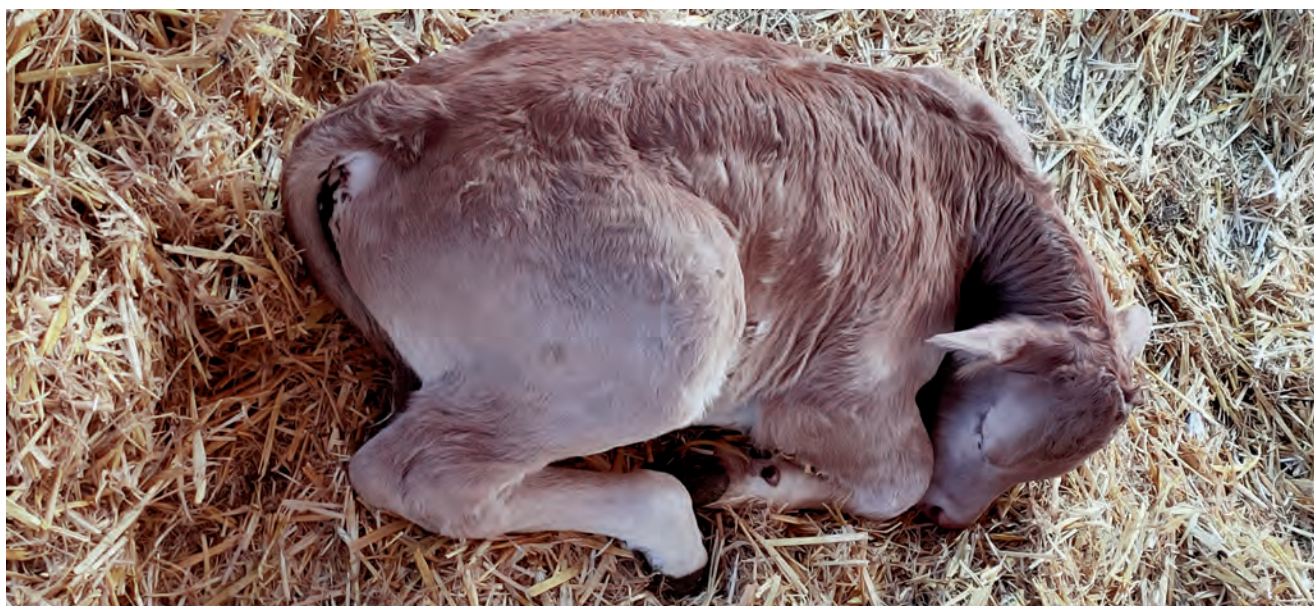
2020AN SALDUTAKO TXEKOR KOPURUA JAITSI EGIN DA