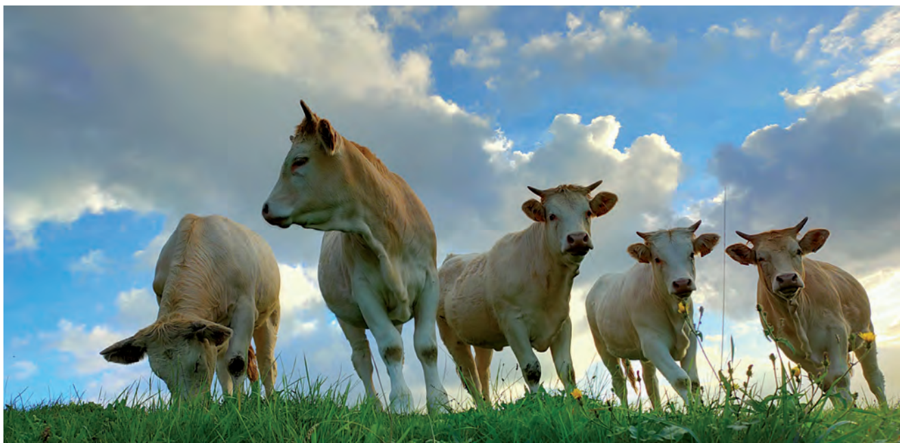
2020AN HARAGI SEKTOREAN LAGUNTZEKIKO MENPEKOTASUNA IGO EGIN DA

tak hiru zetimo gora egin dute. Bestalde, ardi emankorreko litro