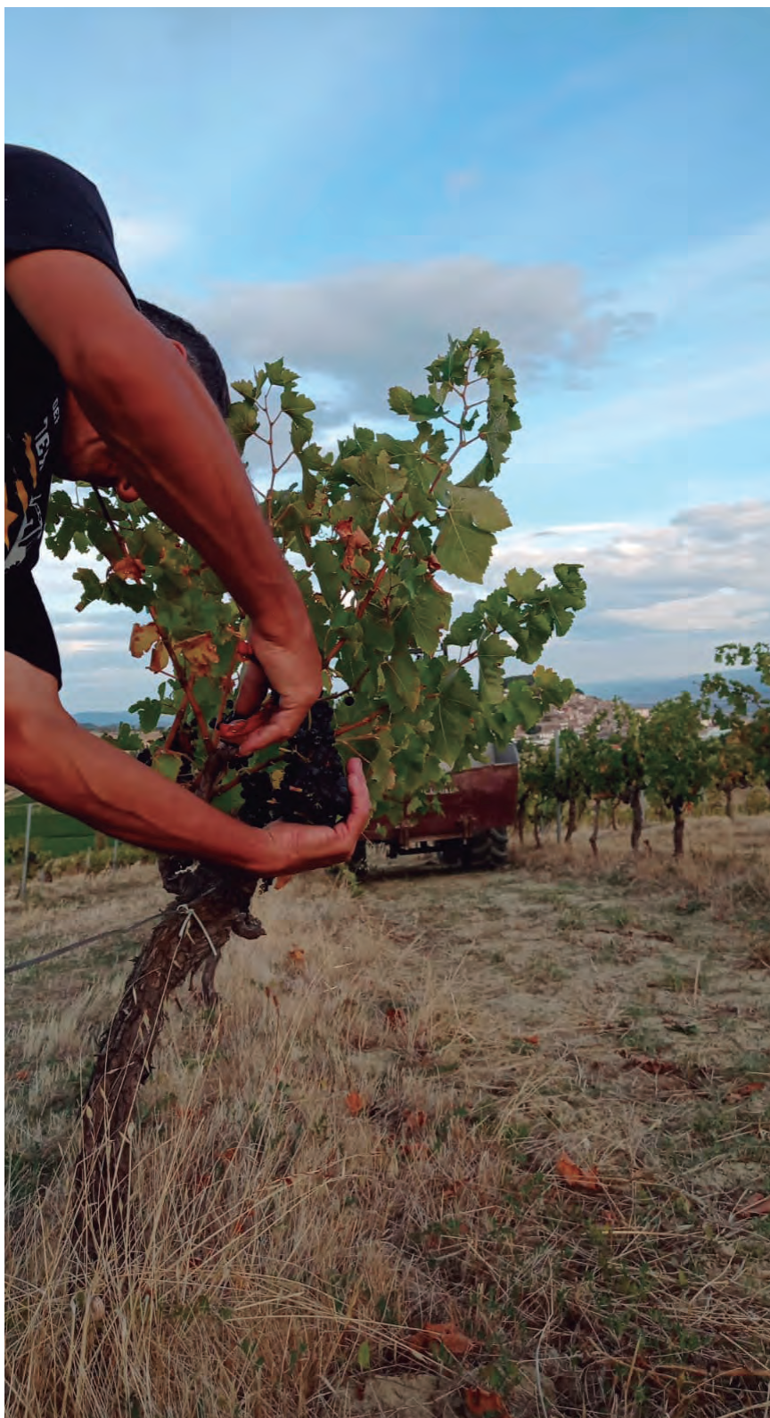
AUNQUE MENOR PRODUCCIÓN, LA CALIDAD DE LA UVA HA SIDO EXCELENTE.

En lo que se refiere a las que permiten elaborar vinos blancos, se han recolectado las variedades Chardonnay, Viura, Garnacha Blanca, Moscatel de Grano Menudo y Sauvignon. En total, son 10.017 las hectáreas que componen actualmente el viñedo acogido a la Denominación de Origen Navarra, vendimiadas durante esta campaña por un total de 1.750 viticultores y 89 bodegas. Durante la segunda parte del pasado noviembre se han recogido también las uvas destinadas a vinos de vendimia tardía.