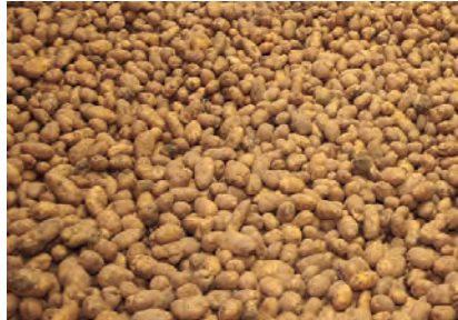
LA CAMPAÑA HA SIDO EXTRAORDINARIA.

La climatología ha ayudado a que las personas productoras de patata hayan realizado las labores del cultivo en buenas condiciones, desde el momento de la siembra. Destacan las templadas temperaturas del verano que han ayudado a un desarrollo óptimo de la patata, obteniéndose una cosecha de mayor calibre y más cantidad.