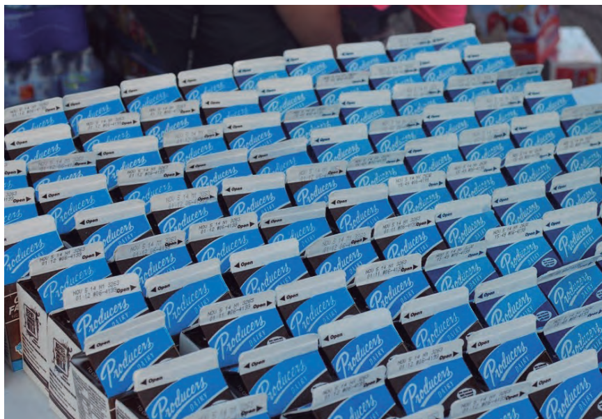
EL PRECIO DE LA LECHE DEBERÍA SUPERAR LOS 0,70€/L

El sector lácteo anuncia movilizaciones para este mes de diciembre, tanto a nivel estatal como en el País Vasco y Navarra. Todas las organizaciones agrarias mantienen la unidad de acción reivindicando ante la industria, la distribución y el ministerio de Agricultura precios que cubran los costes de producción ante las fuertes subidas de costes que el ganadero está experimentando, situadas entre los 5 y 7 céntimos/litro. Las movilizaciones en nuestro Territorio se prevén para la semana del 13 al 17 de diciembre. Las organizaciones han señalado que, “aunque ponemos en valor las subidas de los precios de la leche al ganadero en algunos casos, estas son insuficientes respecto de la situación de subida de costes”, han explicado. COAG, Asaja y UPA denuncian la estrategia de Lactalis y Capsa de bloquear las subidas del precio de la leche en “una actitud inadmisibles de prepotencia y desprecio” a los ganaderos. También se ha solicitado una reunión a la FENIL para abordar la situación y desbloquear el inmovilismo que mantiene la industria y que pone