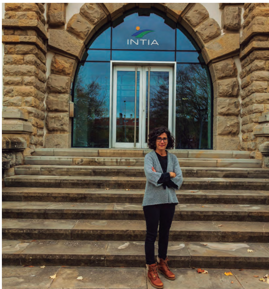
BELLOSTAS RESALTA QUE HAY SINTONÍA MUTUA ENTRE TÉCNICOS Y PRODUCTORES

A nivel europeo se está potenciando la investigación en torno a la capacidad que tiene el suelo para capturar carbono, la reducción de fertilizantes minerales y orgánicos, y también la de fitosanitarios. En el apartado ganadero, se está impulsando lo relacionado con el silvopastoralismo, cómo hacer una gestión sostenible del pastoreo para mantener limpios los montes y, de esta forma, evitar incendios forestales. También se trabaja en modelos productivos que aumenten el retorno económico de los productores, transformación y comercialización propia que incremente el valor que se queda en ese primer eslabón de la cadena.