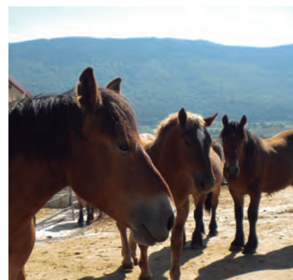
EL MODELO SOCIAL, ÚNICA ALTERNATIVA

miso de la organización en la defensa del modelo social de actividad agraria como única alternativa para la sostenibilidad medioambiental y la seguridad alimentaria. COAG ha pedido a los poderes públicos un apoyo a este modelo y una transición justa e integradora que no deje a nadie atrás.