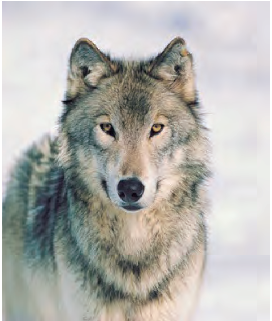
LA CAZA DEL LOBO ESTÁ PROHIBIDA EN TODO EL TERRITORIO DEL ESTADO ESPAÑOL

En el recurso se detallan por comunidades autónomas los daños económicos y sociales que genera la presencia del lobo. En Asturias el número de animales dañados asciende a 12.966 en el periodo 2017-2020; en