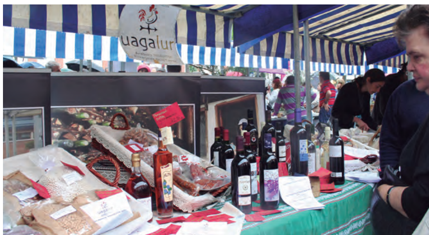
HACE FALTA CREAR NUEVOS CANALES DE COMERCIALIZACIÓN DE PRODUCTO LOCAL.

Uno de los objetivos del debate fue la necesidad de una regulación para facilitar la instalación de explotaciones que diversifiquen la producción del municipio bajo un modelo que favorezca la agrobiodiversidad local. Además, se trataron asuntos relacionados con una regulación que ordene los posibles usos y actividades (productivo, educativo, investigación, lúdico, conservación de agrobiodiversidad, etc.), las necesidades tangibles (invernaderos, despensas, establos, viviendas, cami-