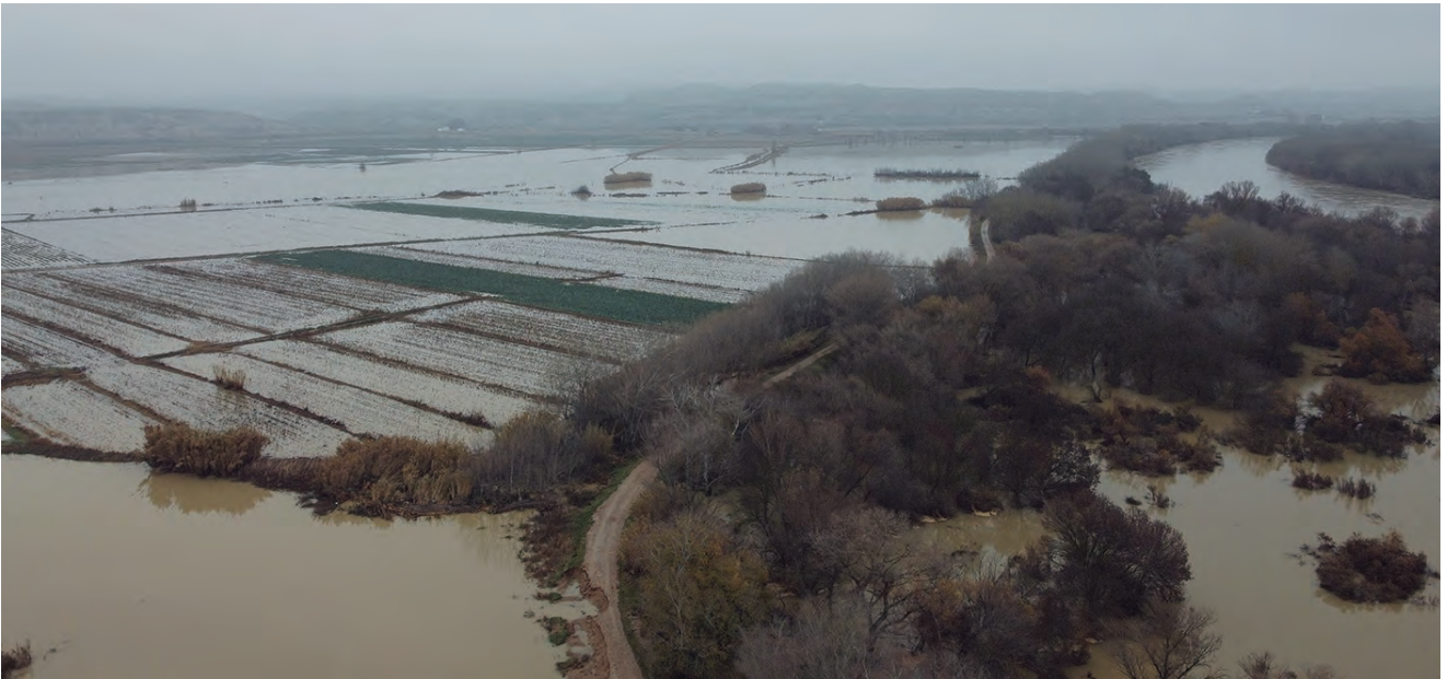
ASPECTO DE UNA DE LAS ZONAS INUNDADAS POR EL RÍO EBRO.