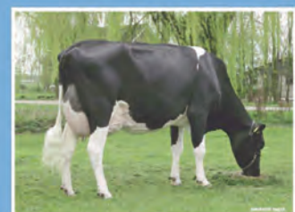
DE BIESHEUVEL JAVINA 3 (VG-87)