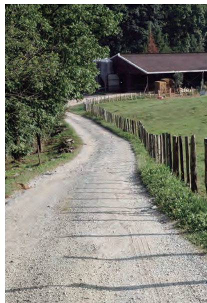
ACCESO A PASTIZALES

Por otra parte, y teniendo en cuenta que a corto plazo se va a poner en marcha la estrategia europea “De la granja a la mesa”, en la que la ganadería extensiva juega un papel crucial, EHNE-Nafarroa entiende que la creación y mejora de las actuales infraestructuras a nivel local (pistas, abrevaderos, cierres, etc.) para poder acceder de manera óptima a los pastos comunales es una inversión que redundará en la sostenibilidad rural y medioambiental.