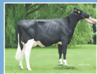
DE BIESHEUVEL JAVINA 50 ET (VG-87)