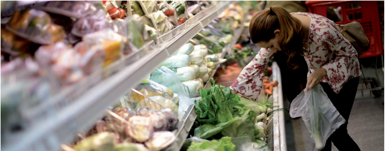
PREZIOEN INDIZEA LEHENBAILEHEN EZARRI BEHARRA NABARMENDU DUTE SEKTOREKO ERAGILEEK

Se necesitan los índices de precios referenciales cuanto antes