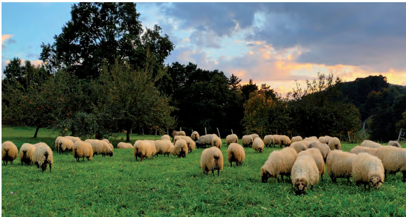
LATXAR ARDI MUTURBELTZAK LARREAN

batzuk errepikatzen badira, informazio genetiko hori esne ekoizpen handiari lotzen diote. “Informazio guztia batu egiten dugu”, argitu du Ugartek. “Orain azkarrago esan dezakegu ardi bat onena edo egokiena dela ardia esnea ematen hasi aurretik, eta gure iragarpenak zehatzagoak eta fidagarriagoak dira”.