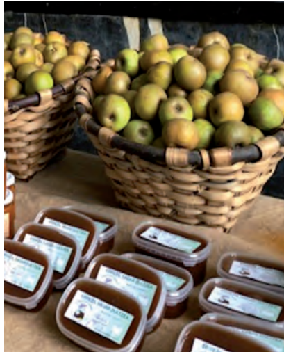
ERRZEIL SAGARRAREN AZOKA

Beste horrenbeste gertatu zen Sagarraren azokarekin Errezilen ere.