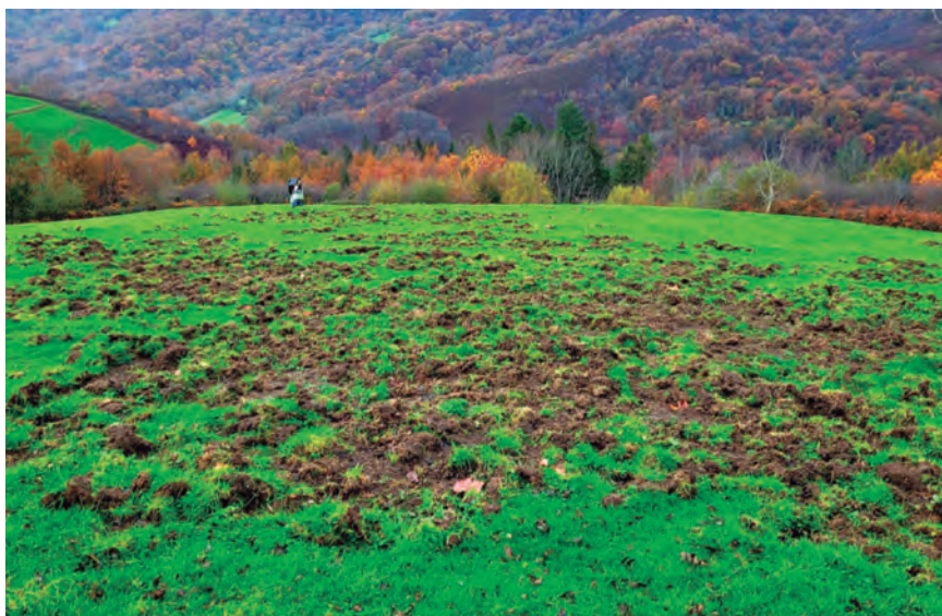
EN ALGUNOS CASOS, LOS DAÑOS ALCANZAN AL 80-90% DE LOS PASTIZALES