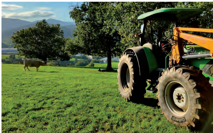
NPB BERRI HAU EZ DA BALIAGARRIA NEKAZAL SEKTOREARENTZAT

Hay dos grupos de ecoesquemas: para una agricultura baja en carbono y los de agroecología, y son siete prácticas en total. En el primer grupo se incluyen cuatro acciones posibles: el aumento de la capacidad de sumidero de carbono de los pastos con el impulso del pastoreo extensivo; la