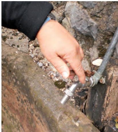
METRO KUBIKOKO 0,03€

-Sujeto pasibo izango dira uraren "kaptazioa" egiten duten pertsona juridiko edo fisikoak.