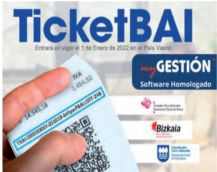
AUTOKONTSUMORAKO FAKTURAK PROGRAMAN EZ SARTZEKO ESKATU DUTE

Hainbat aldiz azaldu zaizkio Gipuzkoako Foru Aldundiko Ogasunari lehen sektoreak dituen berezitasunak eta Ticketbai bezalako