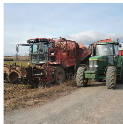
EN ENERO SE RETOMARÁN LOS ARRANQUES

UAGA ha entregado hasta el momento 35.890 toneladas líquidas de remolacha, con un descuento del 12% y una riqueza media de 17,3, lo que supone algo más de la mitad del total de las entregas previstas para esta campaña, en la que el colectivo ha sembrado 500 hectáreas.