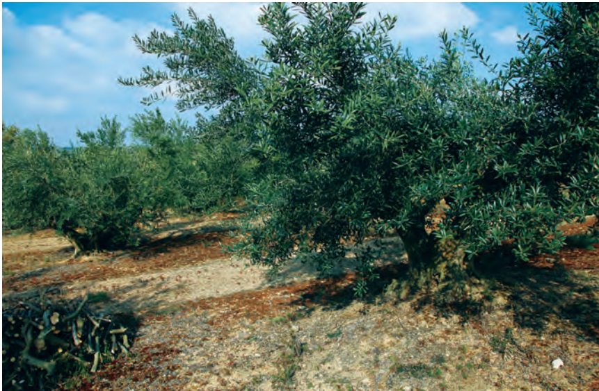
BUENA CALIDAD DE LA ACEITUNA NAVARRA EN LA PRESENTE TEMPORADA