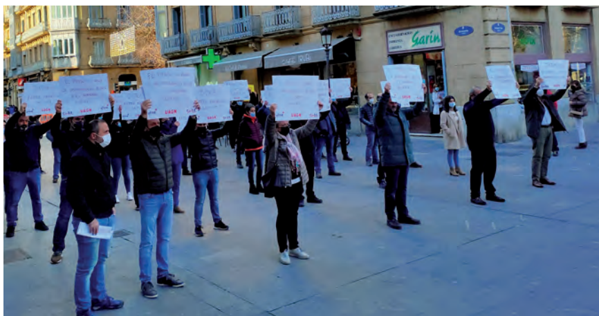
IMAGEN DE LA RUEDA DE PRENSA REALIZADA PARA DAR A CONOCER LAS MOVILIZACIONES

Las organizaciones agrarias EHNE, Enba, UAGN y EHNE Bizkaia, hemos dado a conocer a la sociedad la gravísima situación que viven los profesionales del sector primario y, especialmente, todos los subsectores ganaderos. Al mismo tiempo, exigimos al Gobierno Central la aplicación inmediata de la recién reformada ley de Cadena Alimentaria y a los gobiernos de la CAV y Navarra su desarrollo legislativo.