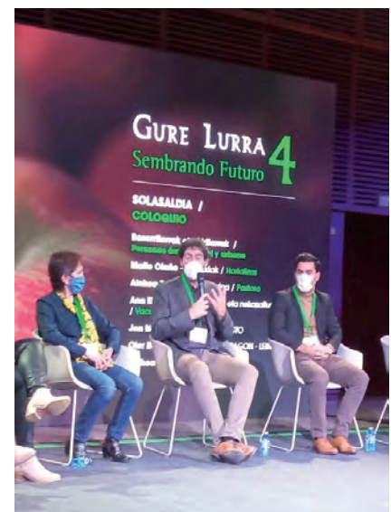
GURE LURRA. IARDUNALDIA

"Ezinbestekoak al gara?". Gure baserritarrek gizarte honetan egiten duten lanaren garrantziaz gogoeta egin eta kontzientzia hartu behar dugu".