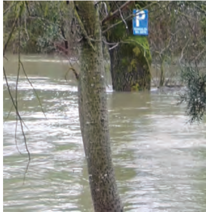
LAS INUNDACIONES SE REPITEN

Desde hace ya mucho tiempo las instituciones están primando el mantenimiento ecológico de los ríos y la salvaguarda de las zonas urbanas a costa del sector primario, que se siente abandonado a su suerte. UAGA exige abordar de una vez por todas el mantenimiento de los ríos, optimizando la