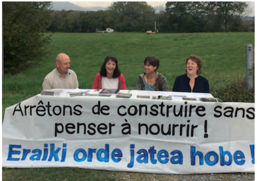
SALAKETAREN BERRI EMANEZ EGINDAKO PRENTSAURREKOKO IRUDIA

“Laborantzarako lurra bere balioa baino kasik 50 aldiz karoago erosiz, espekulazioa bultzatzen da eta laborantzarako aktibitatea izugarri kaltetzen, bereziki herri batengatik egina delarik”, adierazi zuen Lurzaindia elkarteak aipatu eskuo-