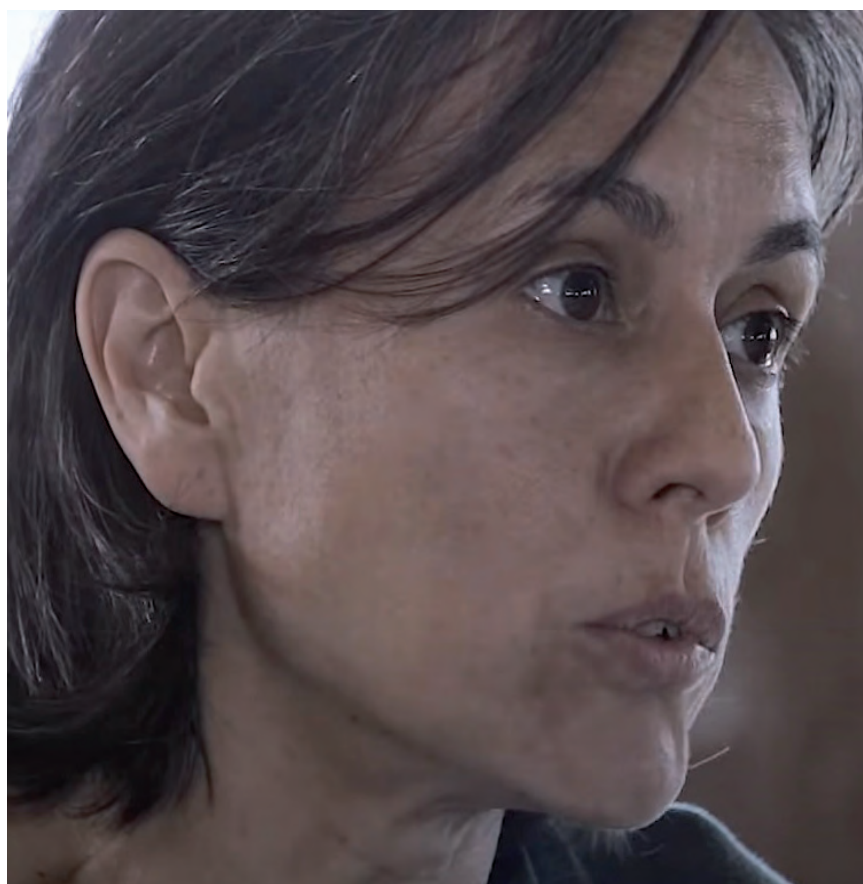
'50 GRAUS' DOKUMENTALEKO IRUDIA

Es un gran problema. La gente urbanita ha perdido completamente la conexión con el mundo rural. El veganismo