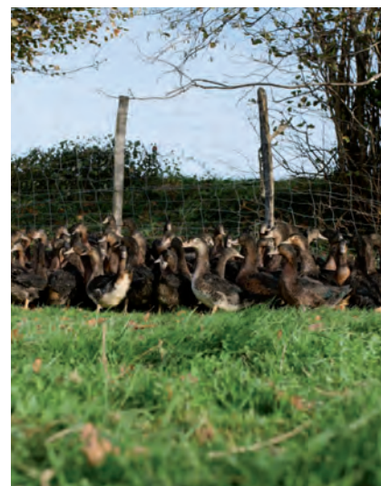
KRIAXERA ARRAZAKO AHATEAK

Era berean, zehaztu dute Europa azken urteetan jasaten ari den hegazti gripe epidemiarik handiena pairatzen ari dela eta orain arte hogeita hamasei herrialdetan eman direla kasuak adierazi dute.