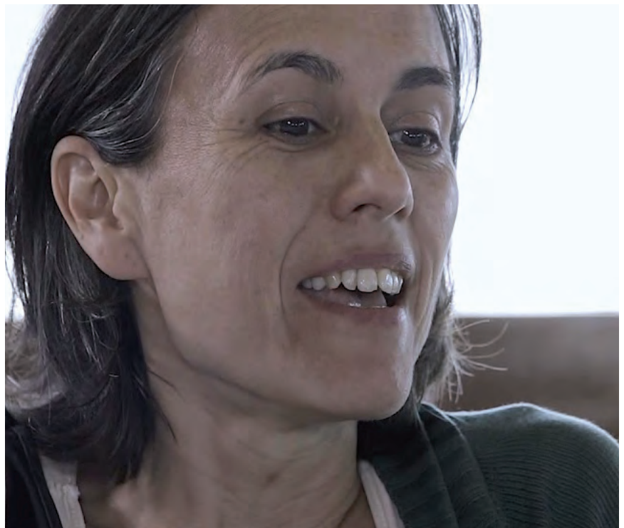
‘50 GRAUS’ DOKUMENTALEKO IRUDIA

mercancía es el que hace que seamos más productivos que nunca.