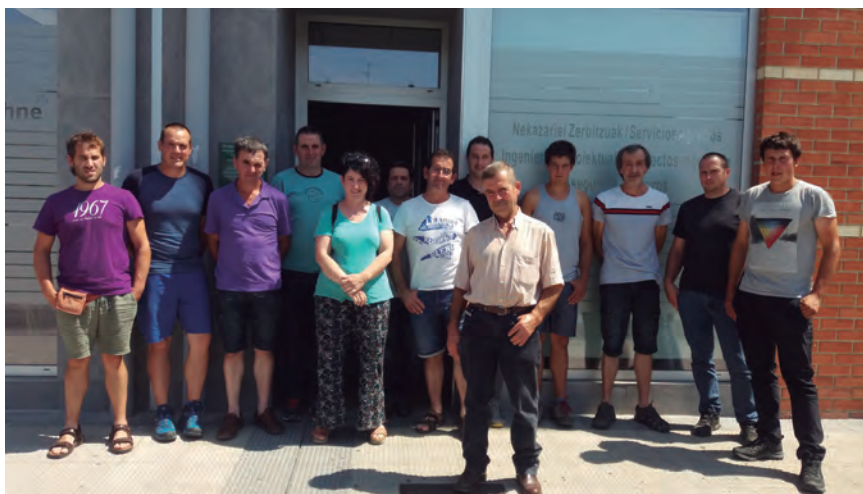
PARTICIPANTES EN LA REUNIÓN CELEBRADA EN LA SEDE DE EHNE-NAFARROA