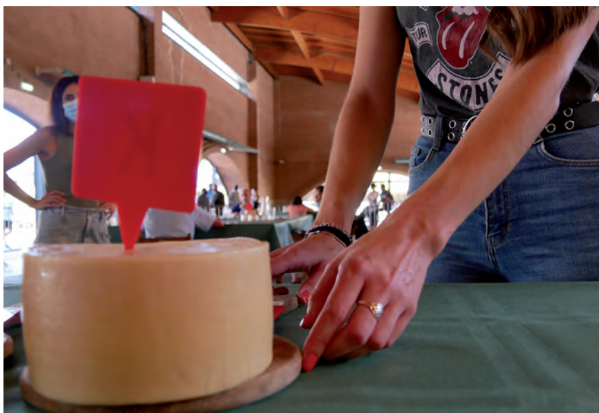
2021EAN EGINDAKO GAZTA LEHIAKETA IRUDIA