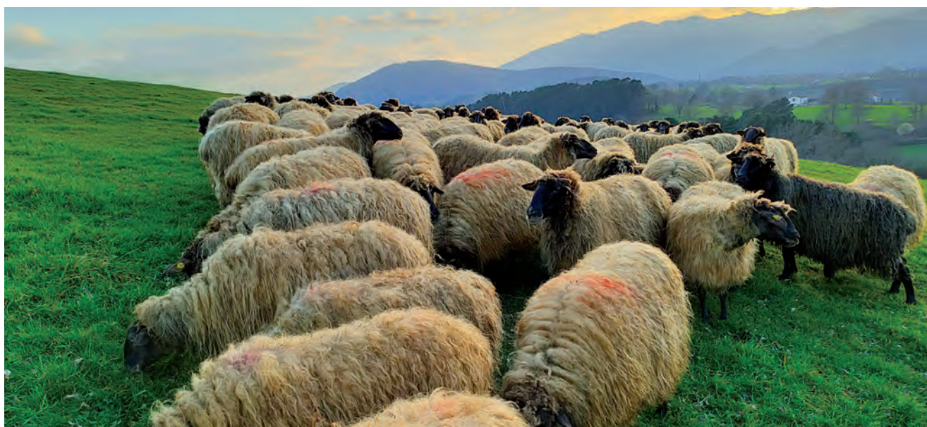
ARDI EMANKORREKO LITRO KOPURUA 108 LITROKOA IZAN ZEN 2021EAN