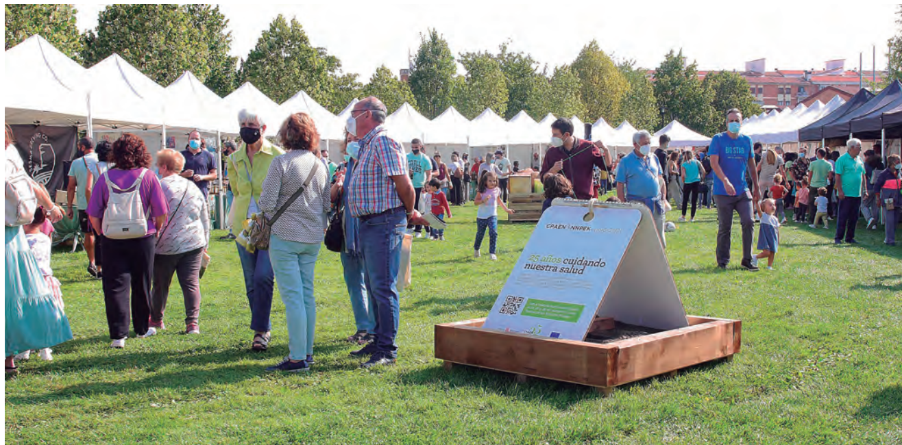
EL PARQUE DE LOS SENTIDOS DE NOAIN VOLVERÁ A ACOGER LA FERIA NAVARRA ECOLÓGICA

Como novedad, una mesa redonda sobre la transición ecológica