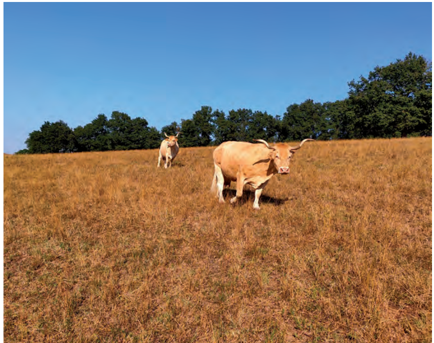
BEHIAK LEHORTUTAKO LARRE BATEAN

Azken denboraldi honetan euririk ez egin izanak lurra lehortu du. Temperatura altuek eta eguzkiak baratzetako fruta eta barazki asko erretzen dizkigu. Abeltzaintzan bazka gutxitu da. Iaz baino %30-50 bazka gutxiago egin dugu gure aberentzat. Mendiko larreetatik abereak baserrietara jaitsi ditugu askok eta askok eta negurako prestatutako elikadura xahutzen hasi gara. Horri guztiari baserri askotako ur hornidu-