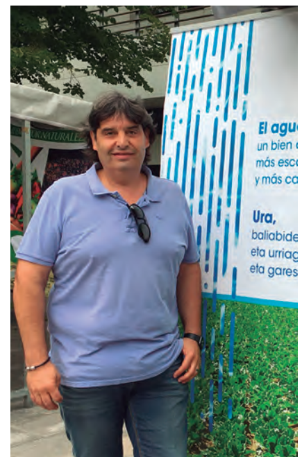
EL PRESIDENTE DE UAGA, EN LA FERIA

UAGA participó el 25 de julio en la Feria de Santiago en Vitoria-Gasteiz que, tras dos años cancelada por causa de la Covid-19, ha vuelto a celebrarse con gran afluencia de agricultores y ganaderos, así como de público en general. El stand de UAGA ha servido este año para sensibilizar respecto al agua, un bien cada vez más escaso y más caro, bien imprescindible para la vida y para el sector agrario muy especialmente. Con la creciente amenaza del cambio climático, optimizar el uso del agua es una necesidad urgente para garantizar la sostenibilidad de las explotaciones agrarias y ganaderas. El incremento gradual de las temperaturas provocará un aumento de la frecuencia e intensidad de extremos climáticos como olas de calor, pedriscos, lluvias torrenciales o escasez de lluvias y, por tanto, escasez de agua, afectando todo ello a la productividad de los cultivos. UAGA defiende los regadíos, pero regadíos económicos, en altura, por su peso, sin bombeo.