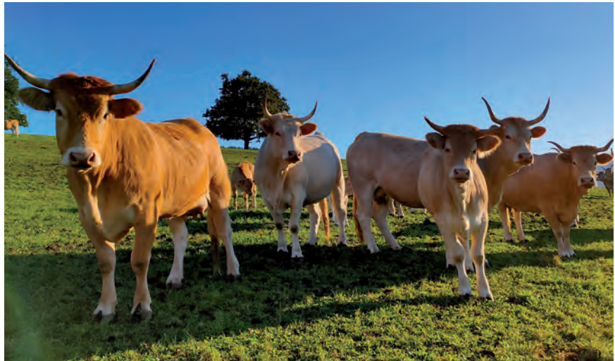
PIRINIAR ARRAZAKO BEHIAK

La feria comenzará el viernes a la tarde donde muchos podrán ver la entrada del ganado al recinto y el sábado comenzará el reparto de premios que continuará hasta el domingo.