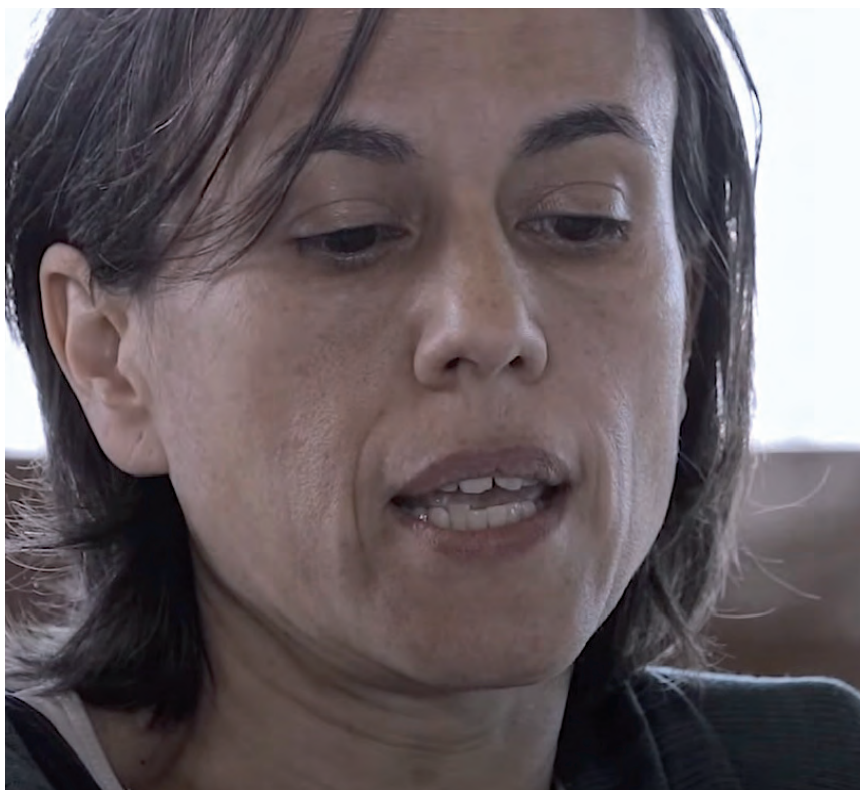
‘50 GRAUS’ DOKUMENTALEKO IRUDIA

Sí, podríamos. Pero implicaría una reconfiguración tan grande en un tiempo tan corto... Sería una situación parecida al corralito en Argentina. Hay un choque, todo se mueve, surgen todas las redes de solidaridad y la ciudadanía responde. Yo creo que las agricultoras responderían. Pero esto no quiere decir que se resuelva porque el sistema esté preparado, que no lo está, sino porque la gente se autoorganizaría. Donde tengo más dudas es en grandes ciudades como Barcelona.