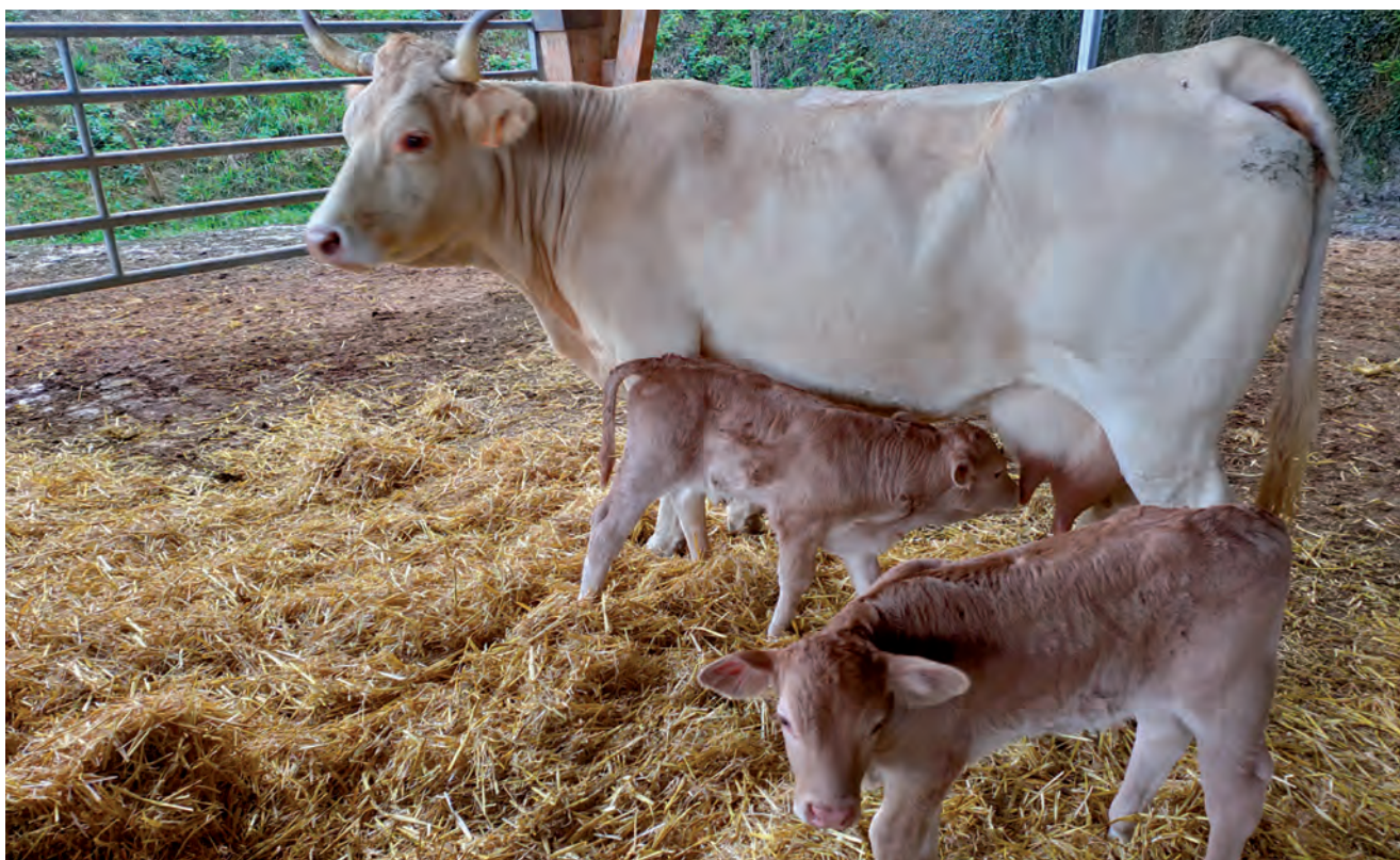
2021EAN PASTEROEN BATEZ BESTEKO PREZIOA 535,55€/BURUKO IZAN DA

“2021ean 2020arekin alderatuz buru kopurua igotzearen joera aldatu da eta gutxi bada ere jaitsi da. Honekin batera, eta bat datorrena da, ustialekuko aterata den batez besteko esne litro kopurua jaitsi dela, baina buruko ekoizpena aldiz pixka bat igo egin da”.