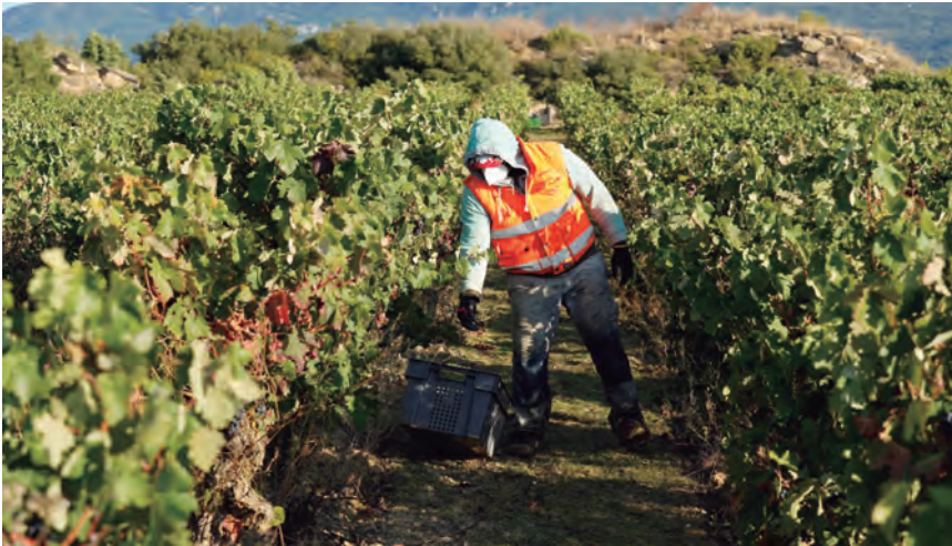
ESTE AÑO SE PREVÉ FALTA DE PERSONAL