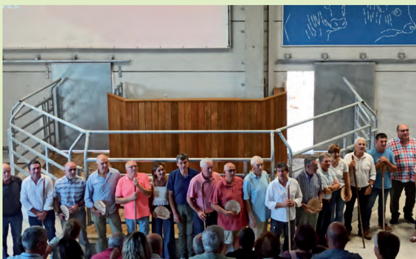
100. LIMOUSIN ARRAZAKO TXEKORREN ENKANTEA. Pasa den uztailaren 24an 100. limousin arrazako txekorren enkantea egin zuten Aiako Testaje Zentroa. Hein berean, zentroko langileen lana, hobekuntza genetikoaren teknika eta zentroak funtziona zezan lan egin duten ordezkari instituzionalena ere omentzeko baliatu zuten.