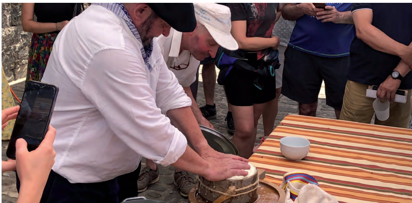
2020KO GAZTAREN SALMENTA PREZIOA 15,50€/KG IZAN DA

tu delarik. Pentsuaren, nahasiaren eta forrajearen kontsumoa ere igo