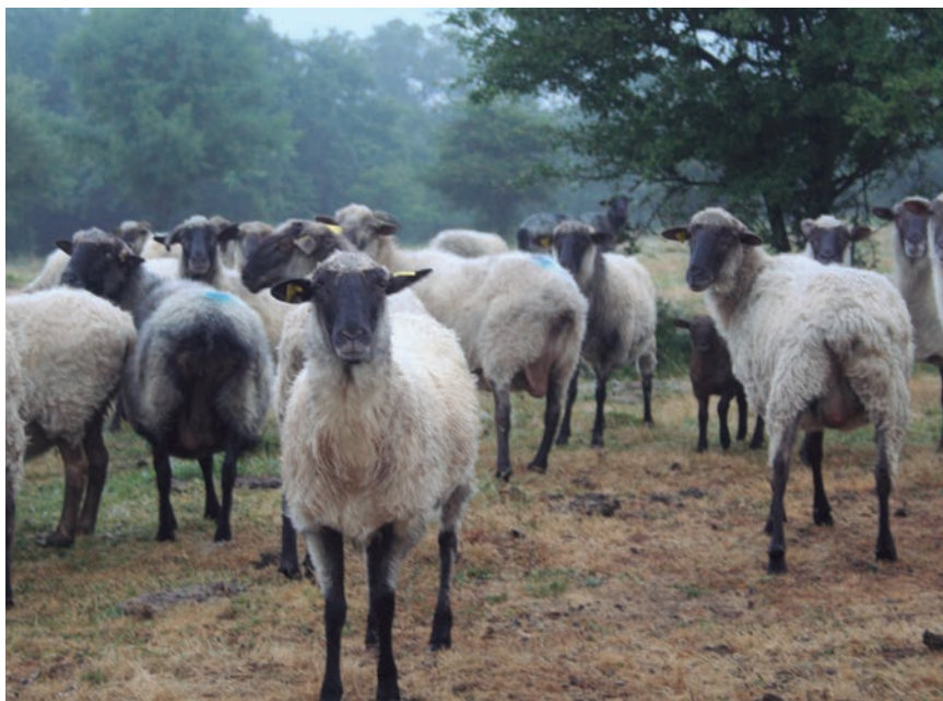
LAS EXPLOTACIONES EN EXTENSIVO TIENEN MAYOR MARGEN DE MANIOBRA.

Frente a estas fragilidades reveladas por la crisis actual, la ECVC cree más necesario que nunca apoyar un modelo agrícola basado en la complementariedad de la ganadería y los cultivos, ya que es la única forma de garantizar la fertilidad del suelo a largo plazo. También pide que se