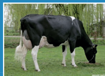
DE BIESHEUVEL JAVINA 3 (VG-87)