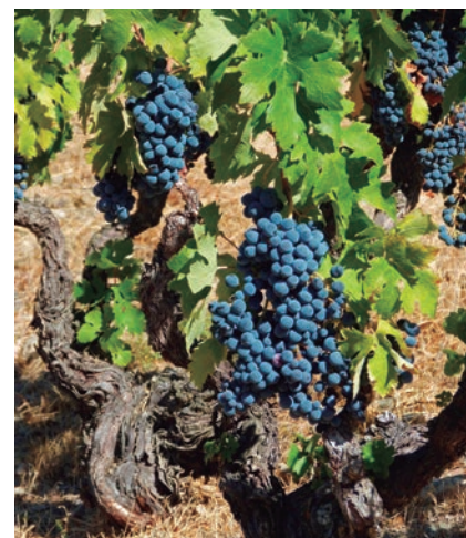
EL OBJETIVO, MANTENER VIÑAS ANTIGUAS.

Los interesados tendrán hasta el 30 de junio para acceder a la convocatoria. En 2020 esta medida alcanzó a 382 beneficiarios, que aseguraron un total de 5.960 hectáreas.