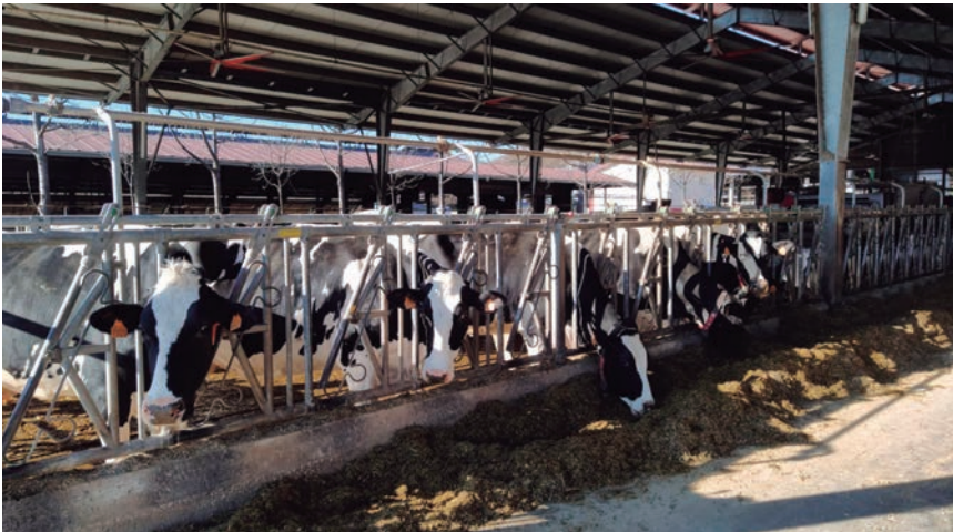
LA PROPUESTA DEL MAPA SUPONDRÍA LA EXPULSIÓN DE MÁS DEL 90% DE LAS GRANJAS.