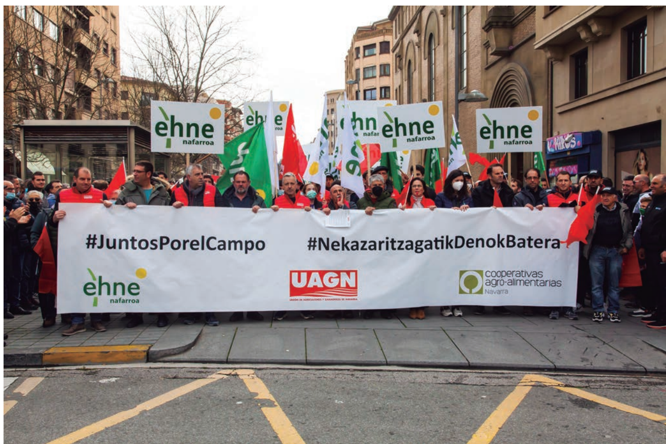
LOS REPRESENTANTES DEL SECTOR AGRARIO NAVARRO ENCABEZARON LA MANIFESTACIÓN