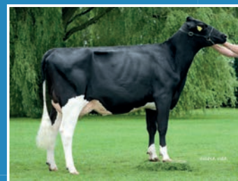
DE BIESHEUVEL JAVINA 50 ET (VG-87)