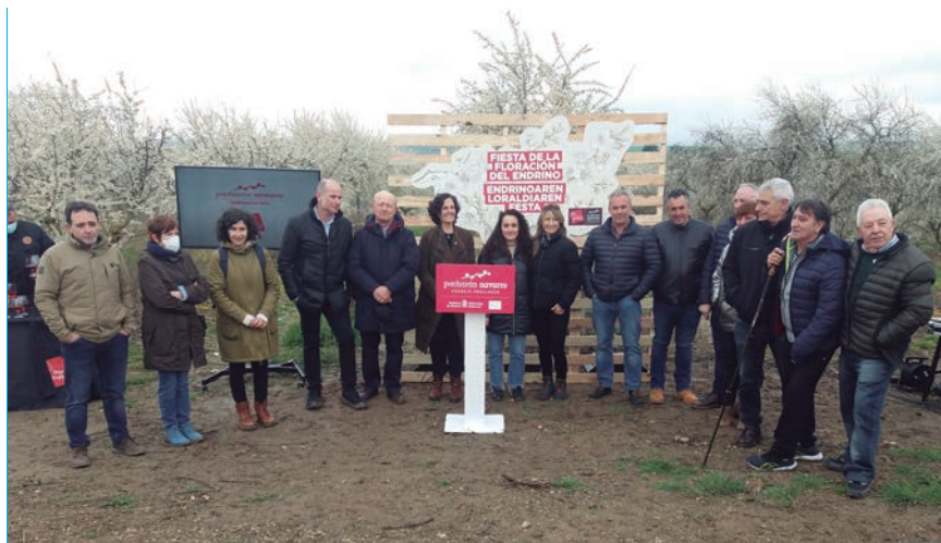
HOMENAJEADOS Y RESPONSABLES INSTITUCIONALES