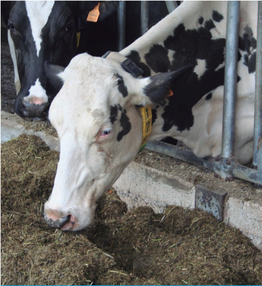
LAS EXPLOTACIONES DE VACUNO DE LECHE, EN RIESGO EXTREMO.

El Dato El 20% del cereal importado viene de Ucrania