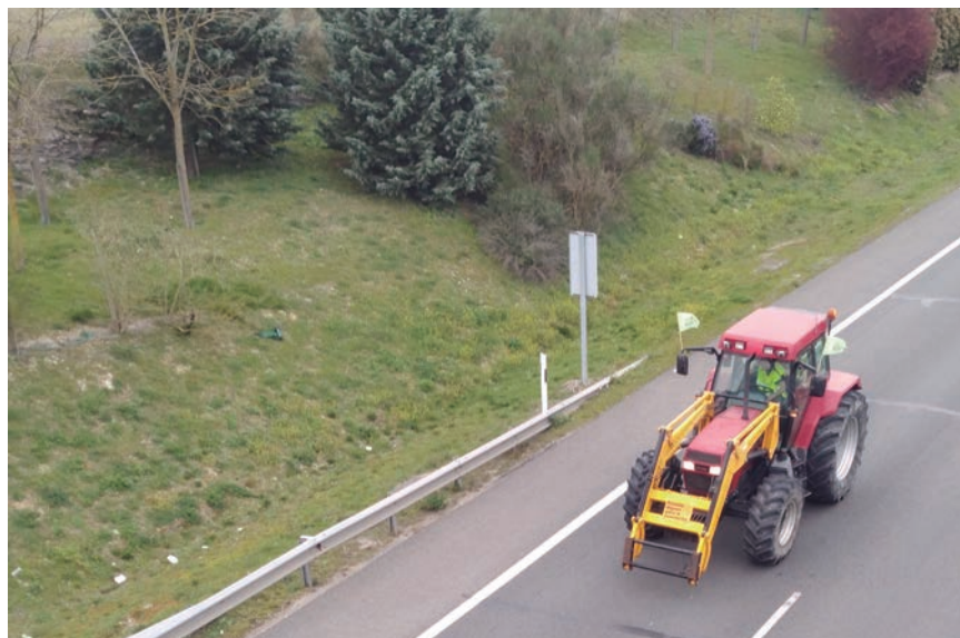
UAGA TRASLADARÁ UNA PROPUESTA DE MEJORAS.

El plazo de solicitud para todas estas ayudas estará abierto hasta el 30 de abril de 2022, coincidiendo con el plazo de solicitud de la PAC y puede realizarse en la OCA correspondiente a la ubicación de la explotación.