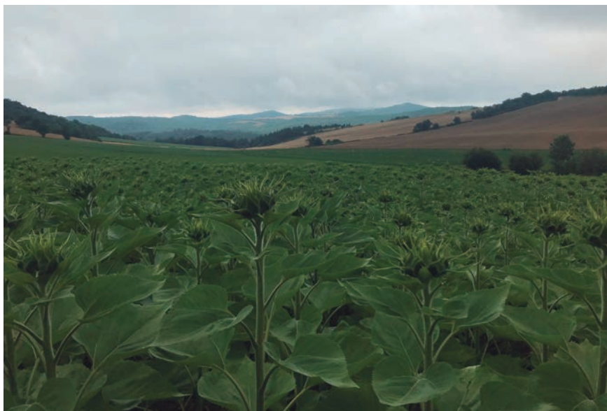
EL GIRASOL VA A DESPLAZAR ESTA CAMPAÑA A OTROS CULTIVOS CON MÁS COSTES.

Por su parte, las tres diputaciones forales de la CAPV han acordado abrir una nueva línea de subvenciones directas para el sector primario, que ascienden a 2,5 millones de euros en Álava, 1,2 millones en Bizkaia y 1,7 millones en Gipuzkoa. Al cierre de esta edición de Ardatza se desconocían los detalles de estas ayudas. El gobierno de Navarra, por su parte, ha anunciado complementará las medidas que tome el Gobierno central con ayudas directas desde Navarra.