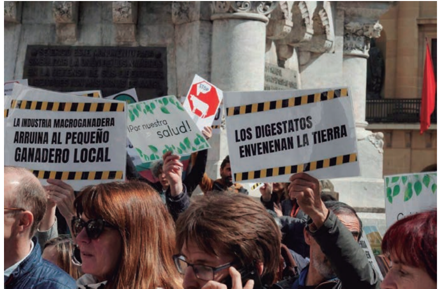
LA PLATAFORMA SEGUIRÁ DENUNCIANDO LA ACTIVIDAD DE LAS MACROGRANJAS

Bajo el lema “Stop Ganadería Industrial. No nos callarán”, la Plataforma Navarra contra las Macrogranjas quiso denunciar la implantación de este tipo de macroexplotaciones en territorio navarro y la “mordaza” que la firma que gestiona la ya existente en Caparroso quiere colocar a quienes critican sus actuaciones, lo que supone un ataque a la libertad de expresión.