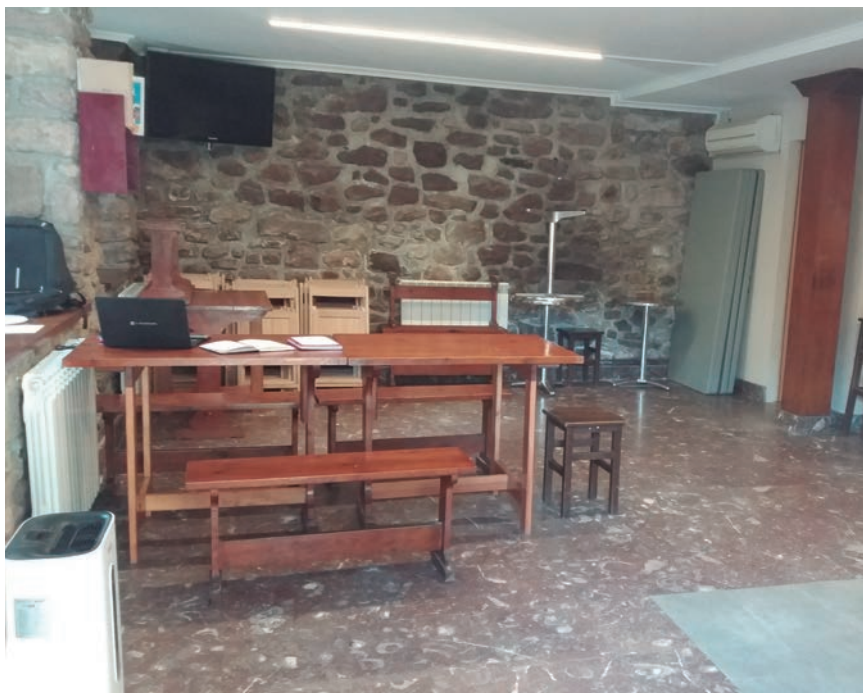
AMEZTI ELKARTEAREN LOKALEAN DAGO BULEGO BERRIA