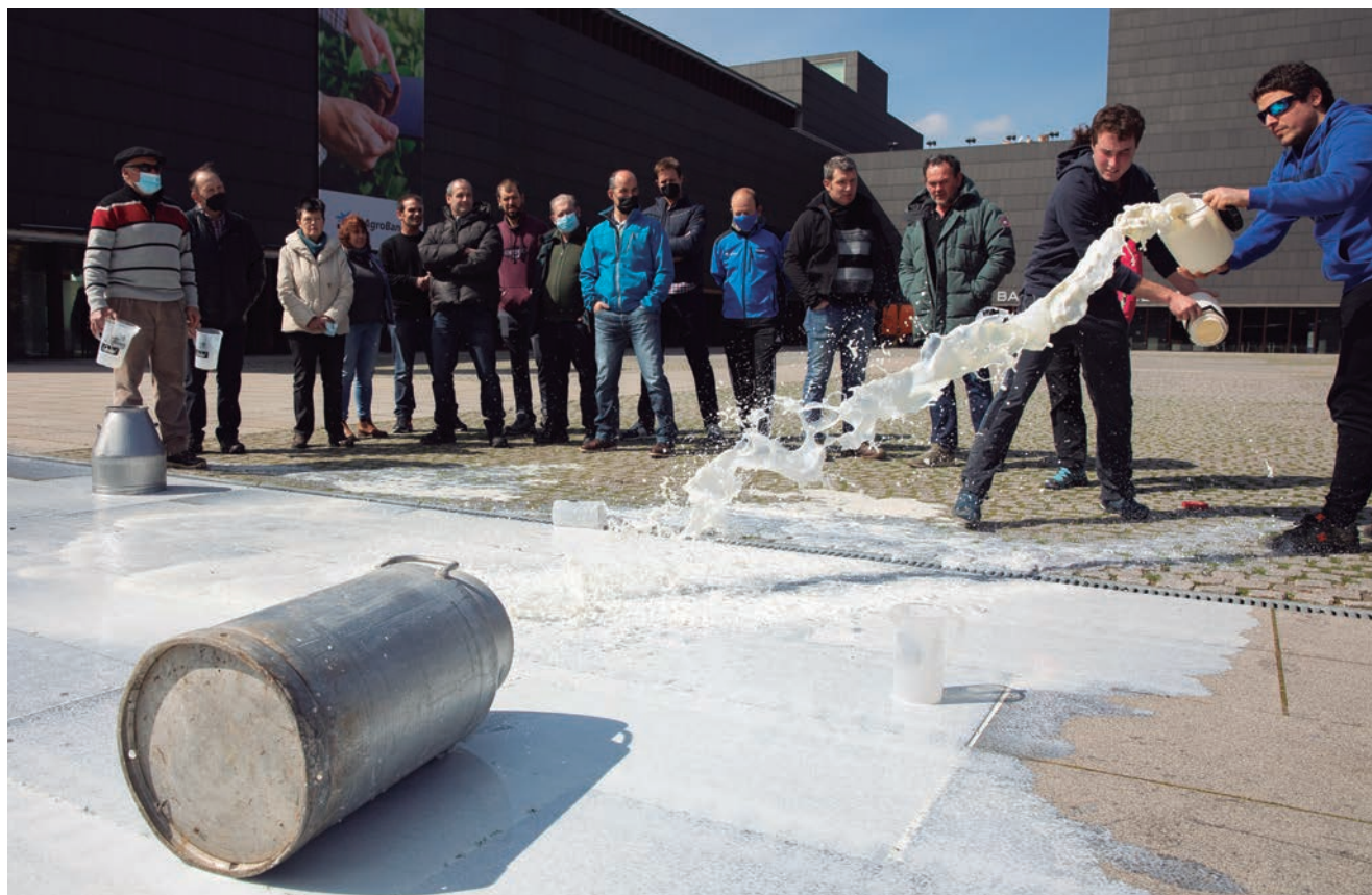
LOS GANADEROS DERRAMARON LA LECHE JUNTO A BALUARTE

Seguirán realizando acciones si no hay una intervención institucional