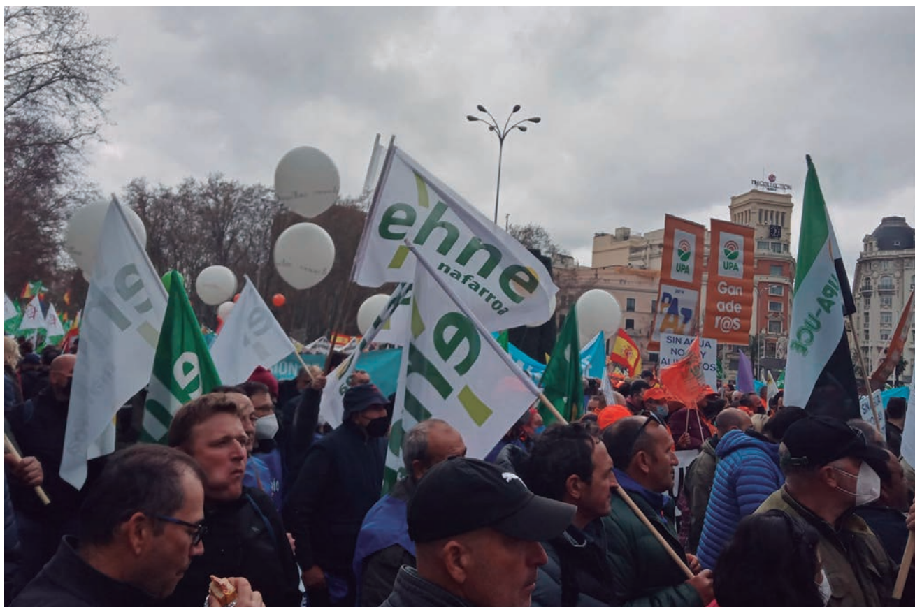
UN CENTENAR DE AFILIADAS Y AFILIADOS DE EHNE PARTICIPARON EN LA MOVILIZACIÓN

“Producir a pérdidas es un mal negocio que nos aboca al cierre y a malvender nuestras tierras a grandes multinacionales y fondos de inversión especulativos. Queremos que el valor de lo que se produce en nuestra tierra se quede en nuestros pueblos y comarcas y no que vaya a engordar las rentabilidades de fondos de pensiones de multimillonarios californianos o cuentas opacas en paraísos fiscales de las Islas Caimán”, reflejó el secretario general de COAG en su alocución.