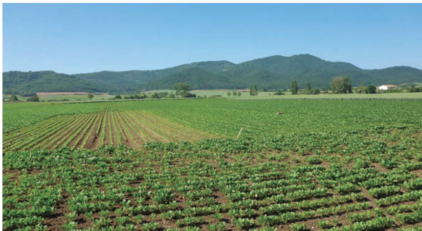
AZUCARERA HA HECHO RECAER SOBRE EL SECTOR GRAN PARTE DEL AJUSTE DE LA CRISIS.

La ausencia de AMI ha permitido estos años introducir cláusulas desleales y abusivas en los contratos que incumplen la Ley de la Cadena Alimentaria en un claro abuso de poder. Estas imposi-