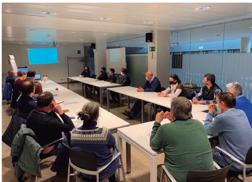
EL PLAN SE PRESENTÓ EN EL DEPARTAMENTO DE DESARROLLO RURAL

En el caso del porcino, hay algunos ganaderos que están realizando un esfuerzo realmente importante por mantener explotaciones con animales de la raza Euskal Txerria, pese a la amenaza de la peste porcina africana y de la competencia del propio sector. En este sentido, vemos muy interesante la apuesta que realiza el plan por el silvopastoralismo, dado su indudable efecto medioambiental positivo en lo que se refiere a la limpieza de los bosques -prevención de incendios- y por el hecho de que aumentará la superficie CAP en dichas zonas, además de hacerlo extensivo a rastrojeras.