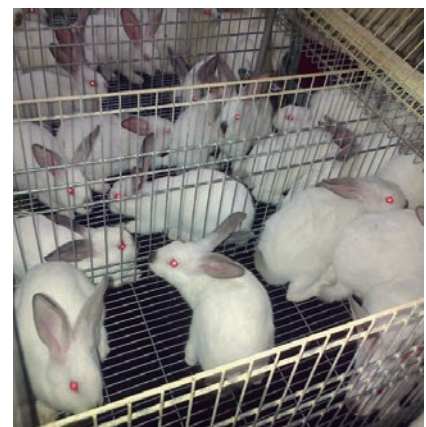
MUCHAS GRANJAS, ABOCADAS AL CIERRE.

Los productores advierten que, si no se corrigen estos desequilibrios el sector no estará en disposición de abordar los objetivos que se pretenden alcanzar con las nuevas estrategias "De la Granja a la Mesa" y de Biodiversidad 2030, así como la iniciativa del fin de las jaulas, elementos esenciales del Pacto Verde Europeo; y cientos de granjas se verán obligadas a echar el cierre.