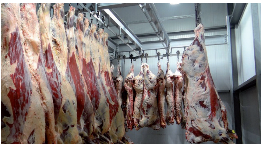
EL OBJETIVO ES MANTENER LA CAPACIDAD PRODUCTORA Y COMERCIALIZADORA DEL SECTOR.