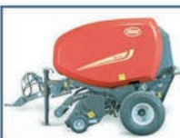
MAQUINARIA DE FORRAJE VICON