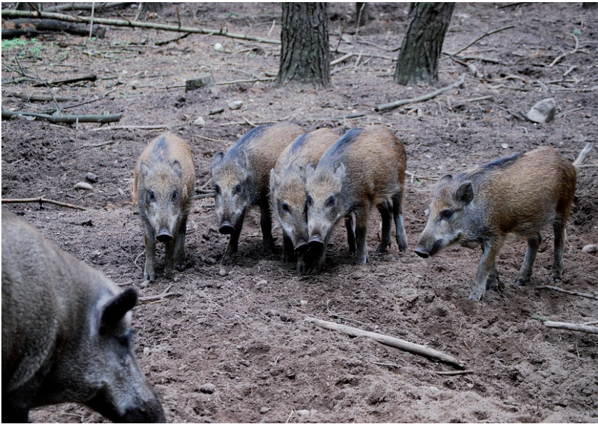
JABALÍES Y CONEJOS SERÁN LAS ESPECIES CINEGÉTICAS QUE SE PODRÁN CAZAR