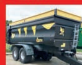
BAÑERA H.G 27M3