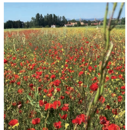
DEBE MANTENERSE LA FINANCIACIÓN.