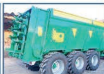
BAÑERAS Y ESPARCIDORES H.G.