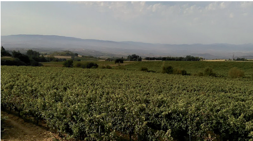
MENOR RENDIMIENTO DEBE IR UNIDO A NO AUMENTAR LAS PLANTACIONES.