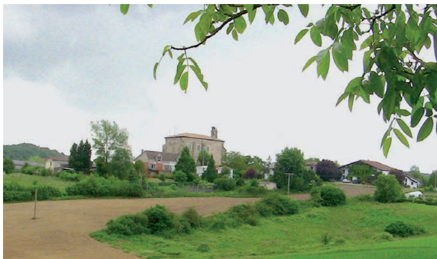
LA NATURALEZA HA SIDO UNA ALIADA EN LOS PUEBLOS PARA VIVIR ESTA SITUACIÓN.

Estos meses se ha puesto de manifiesto que la idiosincrasia del mundo rural y el estilo de vida de nuestros pueblos y núcleos rurales es más necesaria que nunca y que, tras años en segundo plano, cobra una relevancia especial, como preservadora