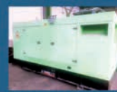
GENERADOR PRAMAC GSW275