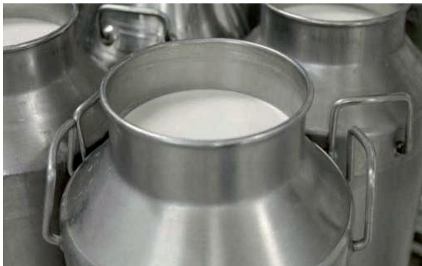
LA APERTURA DEL CANAL HORECA PUEDE SER POSITIVO

Aunque la demanda de patatas frescas ha aumentado, ha caído la demanda de patatas para industria. Por ello, la UE ha autorizado diferentes vías para retirar del mercado o transformar patatas destinadas a industria, y asimismo ha planteado medidas para reducir los volúmenes para futuras plantaciones y el ajuste de los contratos para 2020.