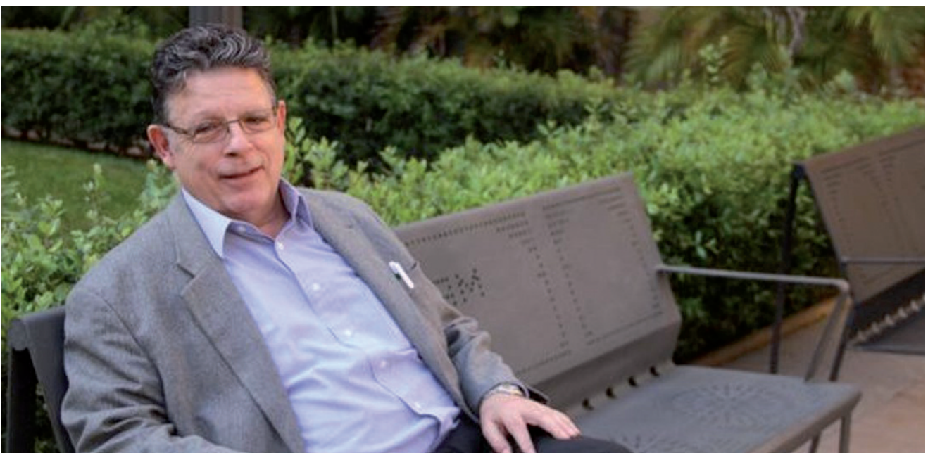
GARCÍA AZCARATE. TEINTERESA WEBGUNEAREN IRUDIA