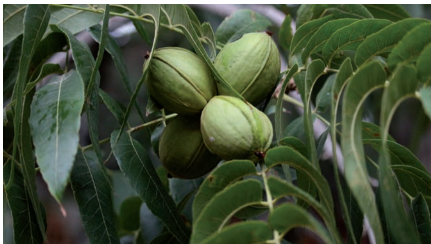
DIVERSIFICACIÓN, NUEVAS ALTERNATIVAS Y SOSTENIBILIDAD, EJES DE LOS PROYECTOS.

lizado 3 pruebas piloto de fertilización de cobertera. La optimización de la fertilización se ha basado en los mapas de rendimiento de las parcelas y en su historial productivo, atendiendo a la complejidad tecnológica de los dispositivos de las distintas marcas comerciales para conectarse entre sí. De esta forma, se ha realizado el abonado de cobertera ajustando la dosis del fertilizante a las necesidades concretas de cada zona de la parcela, teniendo en cuenta diversos parámetros productivos.