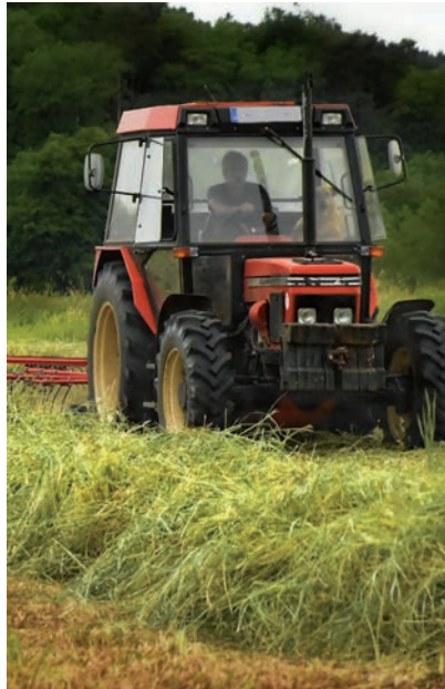
PRESERVAR LA SEGURIDAD ES CLAVE.

La nueva normativa prohíbe el cambio de titularidad (excepto por herencia) de los tractores de más de 40 años sin estructura de protección homologada, una medida destinada a reducir los accidentes que se producen en la agricultura.