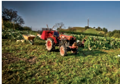
AZAROAREN 10ERA ARTE SALBUESPENA

Alarma egoera ezarri aurretik hasiak ginen herri batzuetan azterketak egiteko datak jartzen, ondoren, ordea,