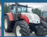
STEYR 6190 CVT