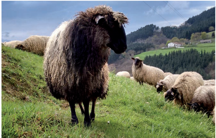
HAY QUE GARANTIZAR QUE SE MANTENGA EL PRECIO DE LA LECHE DE OVEJA

Gipuzkoako EHNETik adierazi dugu Eusko Jaurlaritza eta industrien artean lortutako hitzarmena begi onez ikusten dugula. Baina nabarmendu nahi genuke, esnari aterabidea ematea ez dela edozein modutan egin behar. Gure artzainen ekoizpena, kalitate eta balio erantsi handiko ekoizpena da, errekonozimendu zabalekoa, Idiazabal Jatorri Izendapenaren baitan, eta artzainek jaso beharreko prezioak bermarazi behar dira ezinbestean. Sortzen den