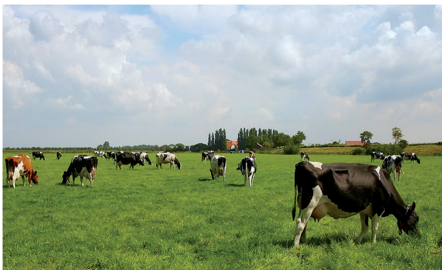
IRUDIAN, ESNE BEHIAK