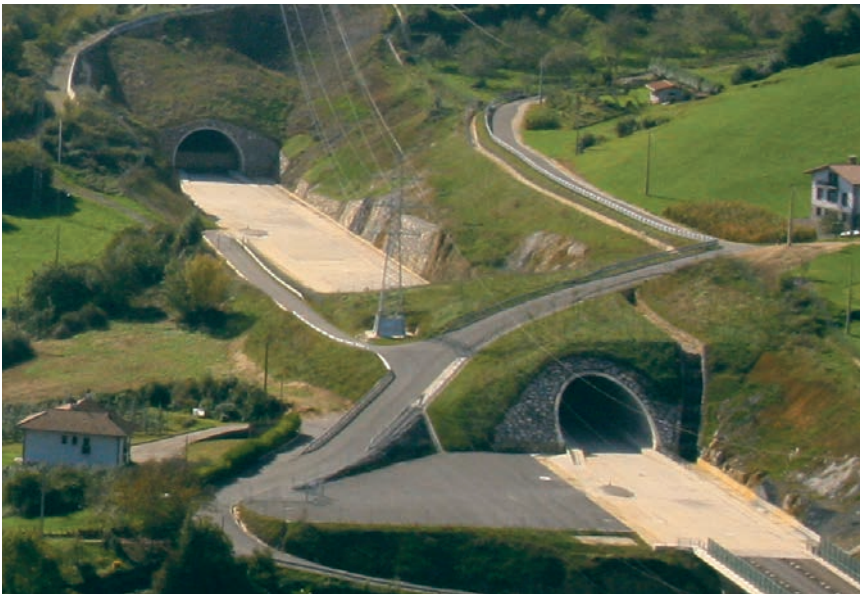
ADUNAN EGINDAKO OBRAREN IRUDIA